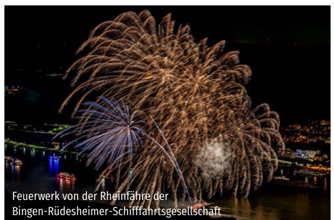
Feuerwerk von der Rheinfähre der Bingen-Rüdesheimer-Schiffahrtsgesellschaft

Alle fünf Veranstaltungen 2025 auf einen Blick: