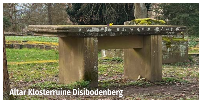
Altar Klosterruine Disibodenberg